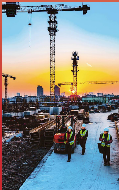
▲九里亭“三大民生实事项目”工地 五洲居民区